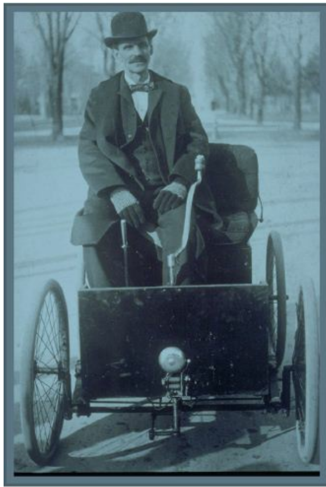
Henry Ford trên chiếc xe Quadricycle năm 1896

Chúng ta không hề biết chắc rằng các bệnh viện được quản lý như hiện nay tồn tại là nhằm phục vụ các bệnh nhân hay các bác sĩ nữa. Tôi không quên rằng một bác sĩ điều trị giỏi hay một nhà phẫu thuật giỏi có thể cống hiến một khoảng thời gian to lớn để phục vụ mục đích từ thiện, nhưng tôi lại không tin rằng chi phí phẫu thuật nên được tính toán theo mức độ giàu có của bệnh nhân. Tôi hoàn toàn tin chắc rằng cái được gọi là “quy ước mặc nhận mang tính nghề nghiệp trong giới y học” là một tai họa đối với loài người và đối với sự phát triển của y học. Vào thời đó, phương pháp chẩn đoán chưa được phát triển cho lắm.