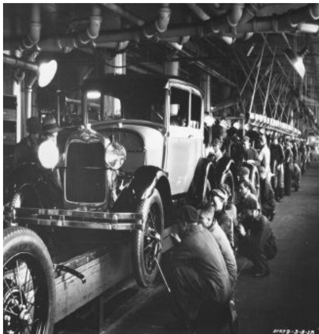
Đây chuyên lắp ráp ô tô trong nhà máy Ford

Người sản xuất khẳng định một cách chắc chắn, “Nó không thể thực hiện được. Không máy móc nào sẽ làm được. Điều đó là không thể thực hiện được”