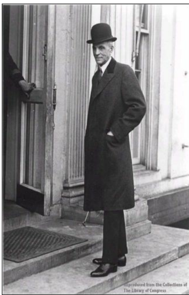
Chân dung của Henry Ford

Quan điểm cho rằng một nước công nghiệp phải tập trung vào những ngành công nghiệp không phải là một quan điểm vững chắc. Tập trung vào hoạt động sản xuất công nghiệp chỉ là một giai đoạn trong lịch sử phát triển của công nghiệp mà thôi. Khi chúng ta biết thêm về sản xuất và biết cách tạo ra các sản phẩm bằng những bộ phận có thể hoán đổi được cho nhau, thì lúc đó chúng ta có thể sản xuất những bộ phận tách rời đó trong những điều kiện tốt nhất có thể có. Trong chừng mực người lao động quan tâm, những điều kiện tốt nhất này cũng là những điều kiện tốt nhất xét trên góc độ sản xuất. Người ta không thể đặt một cỗ máy lớn trong một dây chuyền sản xuất nhỏ nhỏ nhưng có thể đưa một máy móc nhỏ vào trong một dây chuyền nhỏ và sự kết hợp giữa nhiều máy móc, thiết bị nhỏ mỗi bộ máy, thiết bị chế tạo một bộ phận đơn lẻ, sẽ tạo ra 1 sản phẩm rẻ hơn so với sản phẩm sản xuất trong một nhà máy cực lớn. Tuy nhiên, cũng có những trường hợp ngoại lệ, đó là việc đúc sản phẩm. Trong trường hợp này, như tại nhà máy ở River Rouge, chúng tôi muốn kết hợp việc sản xuất với việc đúc kim loại, đồng thời chúng tôi cũng muốn sử dụng hết năng lượng điện bị dư thừa. Việc này đòi hỏi đầu tư phải mở rộng và phải có đủ nhân lực tập trung ở một địa điểm. Nhưng đây cũng chỉ là một trường hợp ngoại lệ chứ không xảy ra như một quy luật, do vậy không ảnh hưởng nhiều đến quá trình phi tập trung hoá công nghiệp.